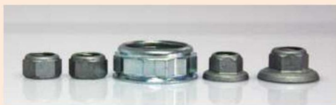
Гайки FH FS® E-economic Лёгкое исполнение

FH FS® E-economic усиленная гайка особой формы