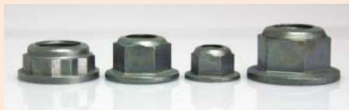
Гайки FH FS® E-economic с фланцем ГОСТ Р ИСО 12126/ГОСТ Р ИСО 7044/ DIN EN ISO 7044