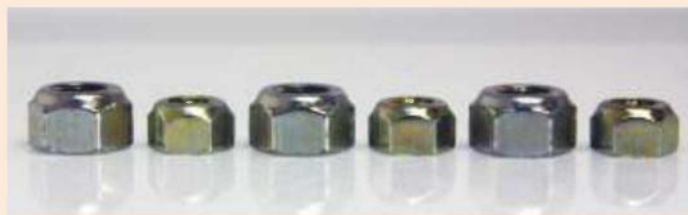
Гайки FH FS® E-economic DIN EN ISO 7042/ГОСТ Р ИСО 7042/ГОСТ Р ИСО 10513