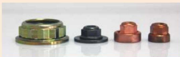
Гайки FH FS® E-economic с вращающимся фланцем